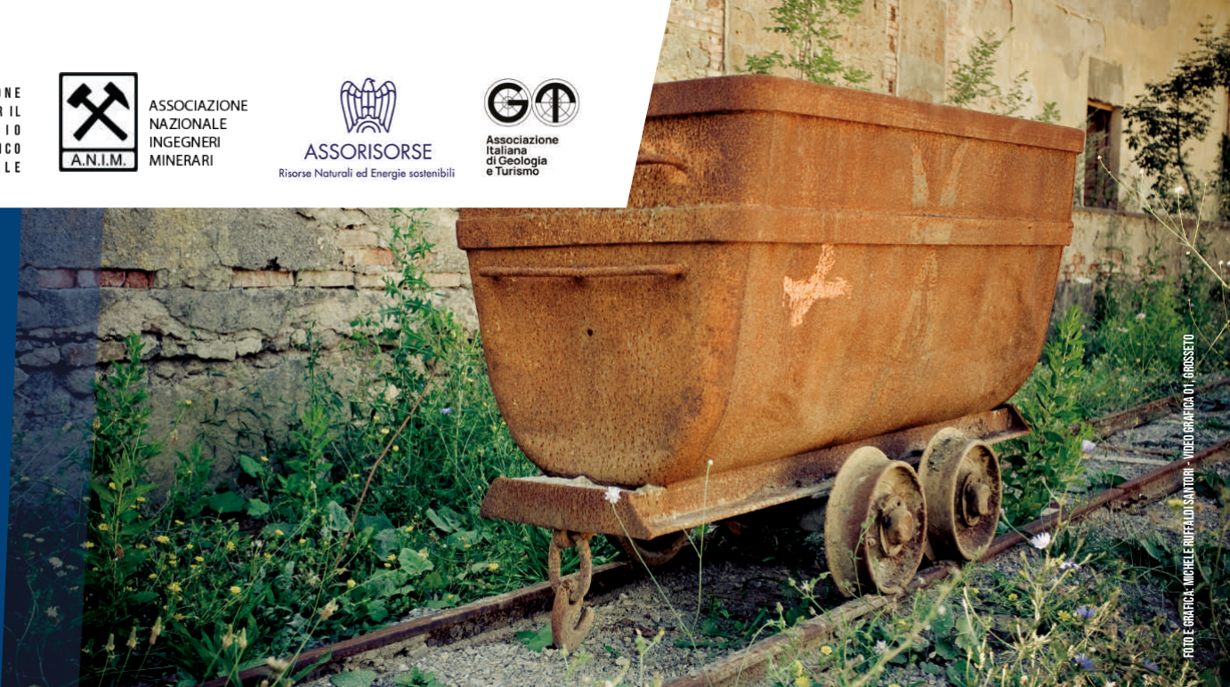
FOTO: E. GARIBOLDI - MICHELE RUFINO/SANTORI - VIDEO GARIBOLDI 01 - GROSSETO